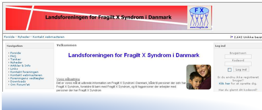
Foreningens nye hjemmeside – forsidelayout.

Som så meget andet arbejde i foreningen (bestyrelsen) er også arbejdet med hjemmesiden frivilligt og ulønnet arbejde. Det har derfor været et mål at løsningen skulle baseres på det der kaldes et framework – et rammeværktøj, som ville kræve mindst mulig vedligeholdelse. Dermed skal det dog ikke konkluderes at indholdet danner sig selv. Valget er derfor faldet på en OpenSource løsning baseret på PHP, kaldet PHP Fusion . Den er gratis at bruge, så længe man overhold-